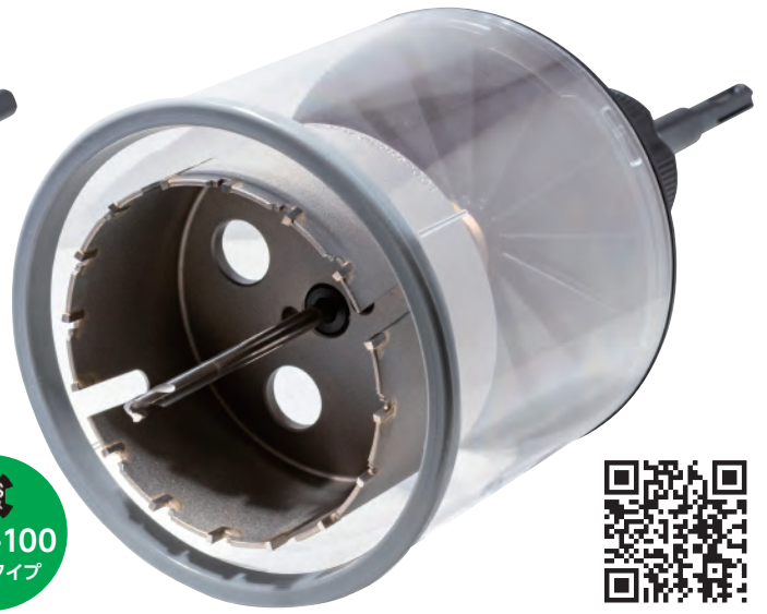
SDS プラス TMZ-100 SDS タイプ